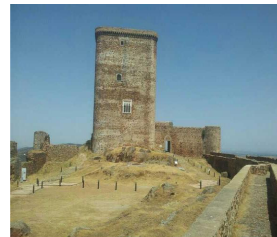
TORRE DEL HOMENAJE