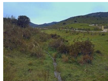
Puerto la Bejera

Seguimos a la izquierda por la pista asfaltada de La Lapa hasta el puerto de La Bejera, pero en lugar emprender el pronunciado descenso, tomamos a la izquierda un sendero que discurre por la falda de la Sierra del Palacio hasta llegar al Puerto de los Serranos, entre esta sierra y Sierra Vieja.