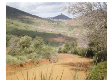
Puerto Los Serranos

Continuamos por el camino bien marcado que discurre por el paraje de Cubillo obviando siempre ocasionales desviaciones hasta llegar al Pilar de Arriba. Desde este punto regresamos al pueblo por el camino de partida.