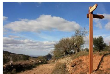
Puerto de la Zorra

Subimos por el camino de la derecha llamado de La Zorra que no abandonaremos hasta el Puerto del mismo nombre. En este punto iniciamos una bajada de cierto pendiente hasta desembocar en un camino principal, el llamado Callejón de Sevilla que nos conducirá hasta La Rivera.