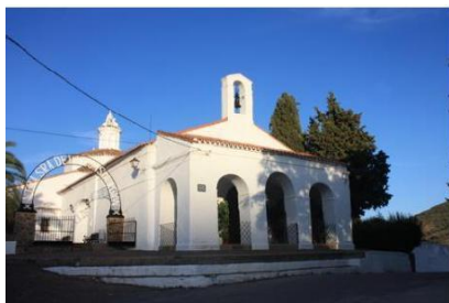
Ermita de los Mártires

RECORRIDO: Partiendo de la plaza de Feria, por la calle los Mártires hasta el Cementerio, se llega al Pilar de Arriba, un abrevadero de amplio pilón, tras abandonar la carretera en la primera curva. Sorteamos el regato del mismo nombre por un rústico puente de piedra hasta encontrar a los pocos pasos una bifurcación.