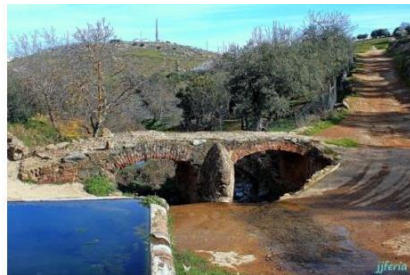
Puente del Pilar de Arriba

Subimos por el camino de la derecha llamado de La Zorra que no abandonaremos hasta el Puerto del mismo nombre. En este punto iniciamos una bajada de cierto pendiente hasta desembocar en un camino principal, el llamado Callejón de Sevilla que nos conducirá hasta La Rivera.