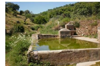
Pilar de Arriba